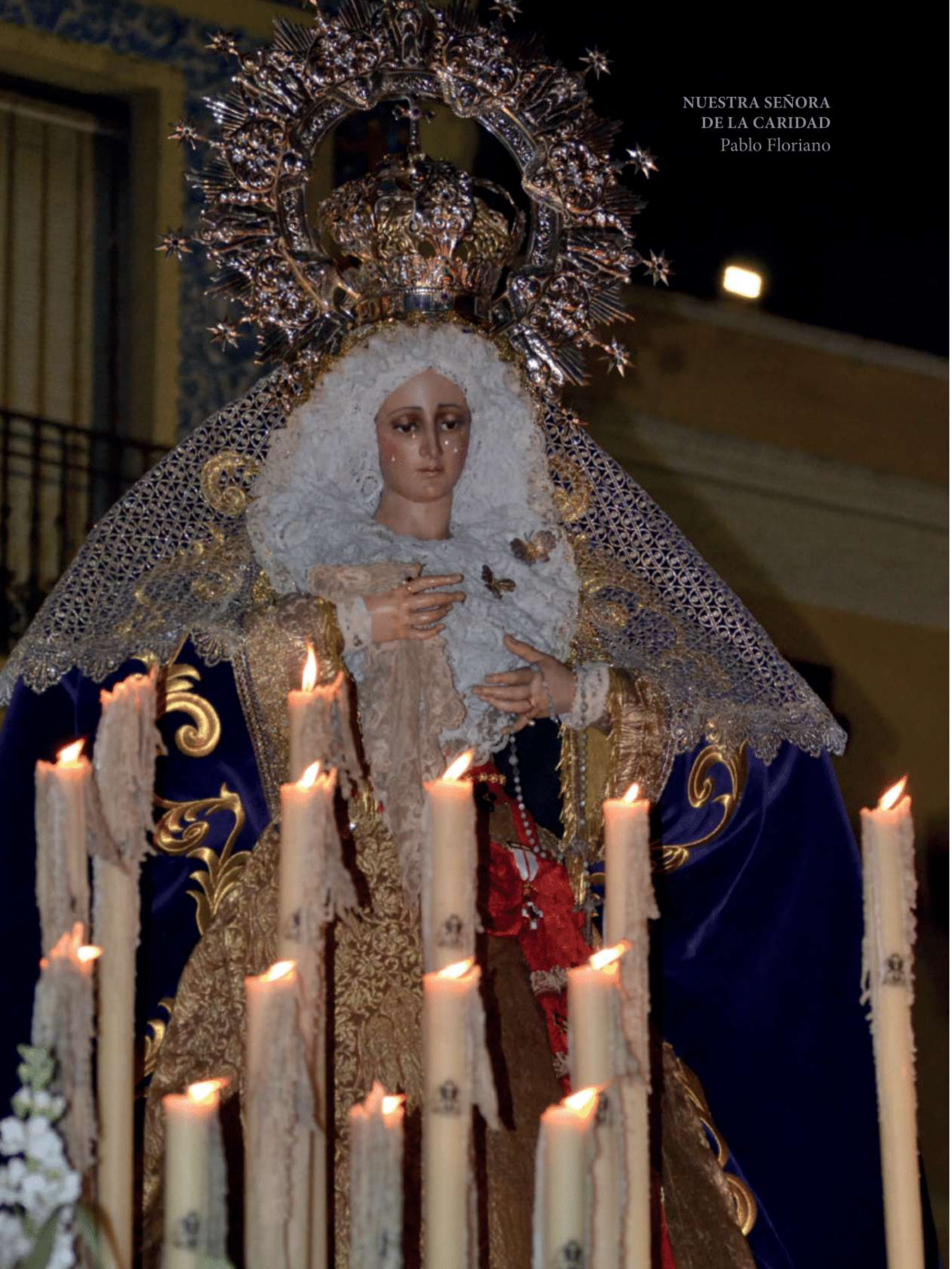
NUESTRA SEÑORA DE LA CARIDAD Pablo Floriano