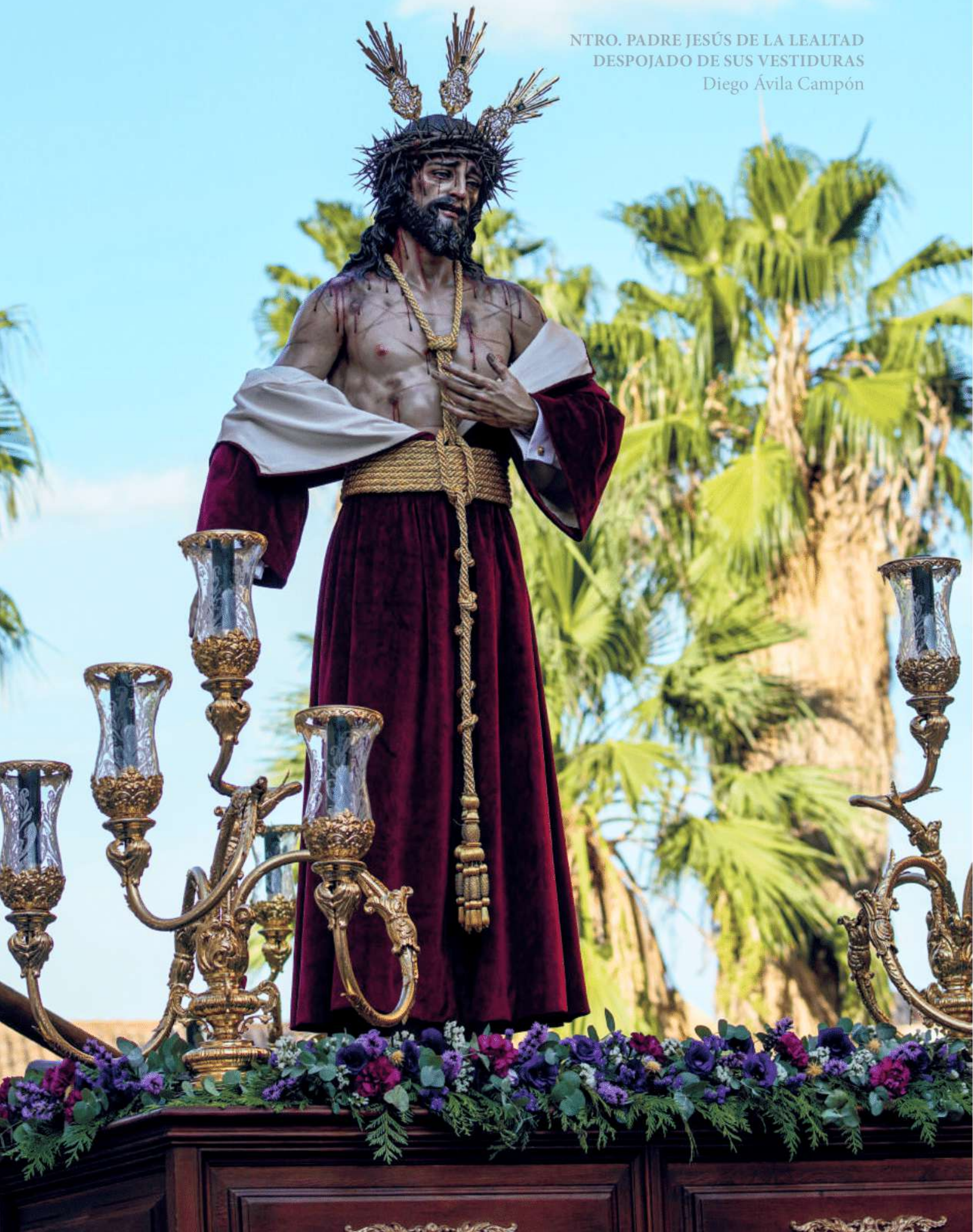
NTRO. PADRE JESÚS DE LA LEALTAD DESPOJADO DE SUS VESTIDURAS Diego Ávila Campón