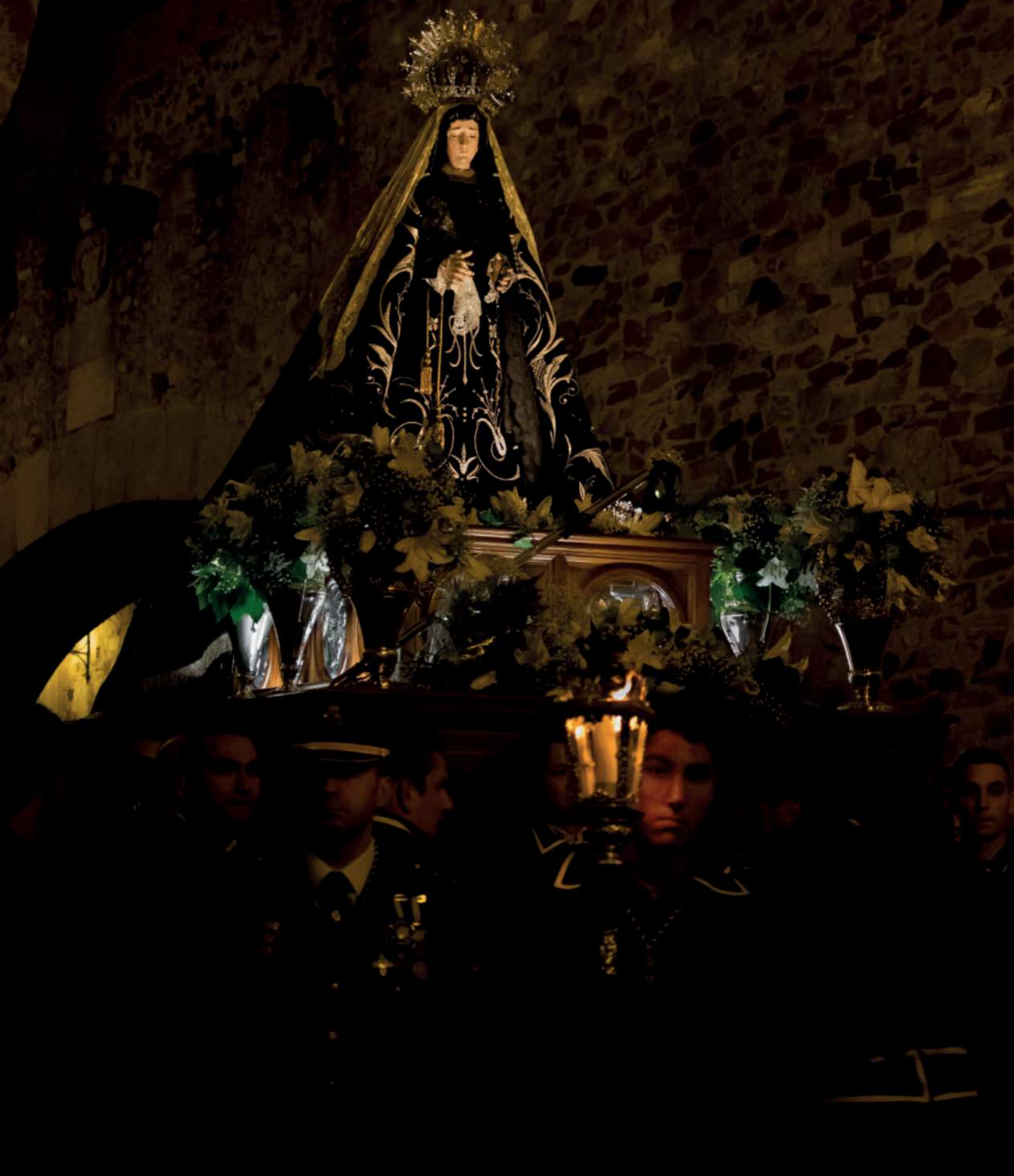
SANTÍSIMA VIRGEN DE LA SOLEDAD Manuel Hinojal