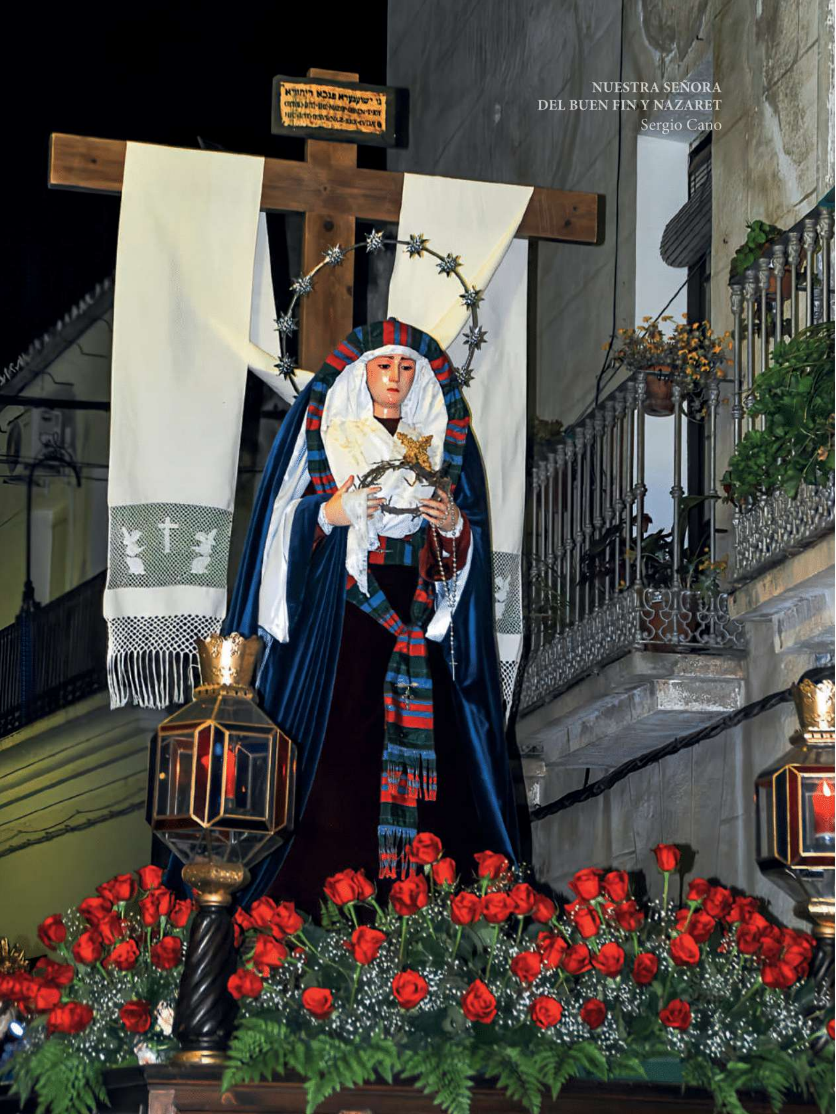
NUESTRA SEÑORA DEL BUEN FIN Y NAZARET Sergio Cano

וְיִשְׁעֵיךָ נֹכַח יְרוּשָׁלַם וְיִשְׁעֵיךָ נֹכַח יְרוּשָׁלַם וְיִשְׁעֵיךָ נֹכַח יְרוּשָׁלַם