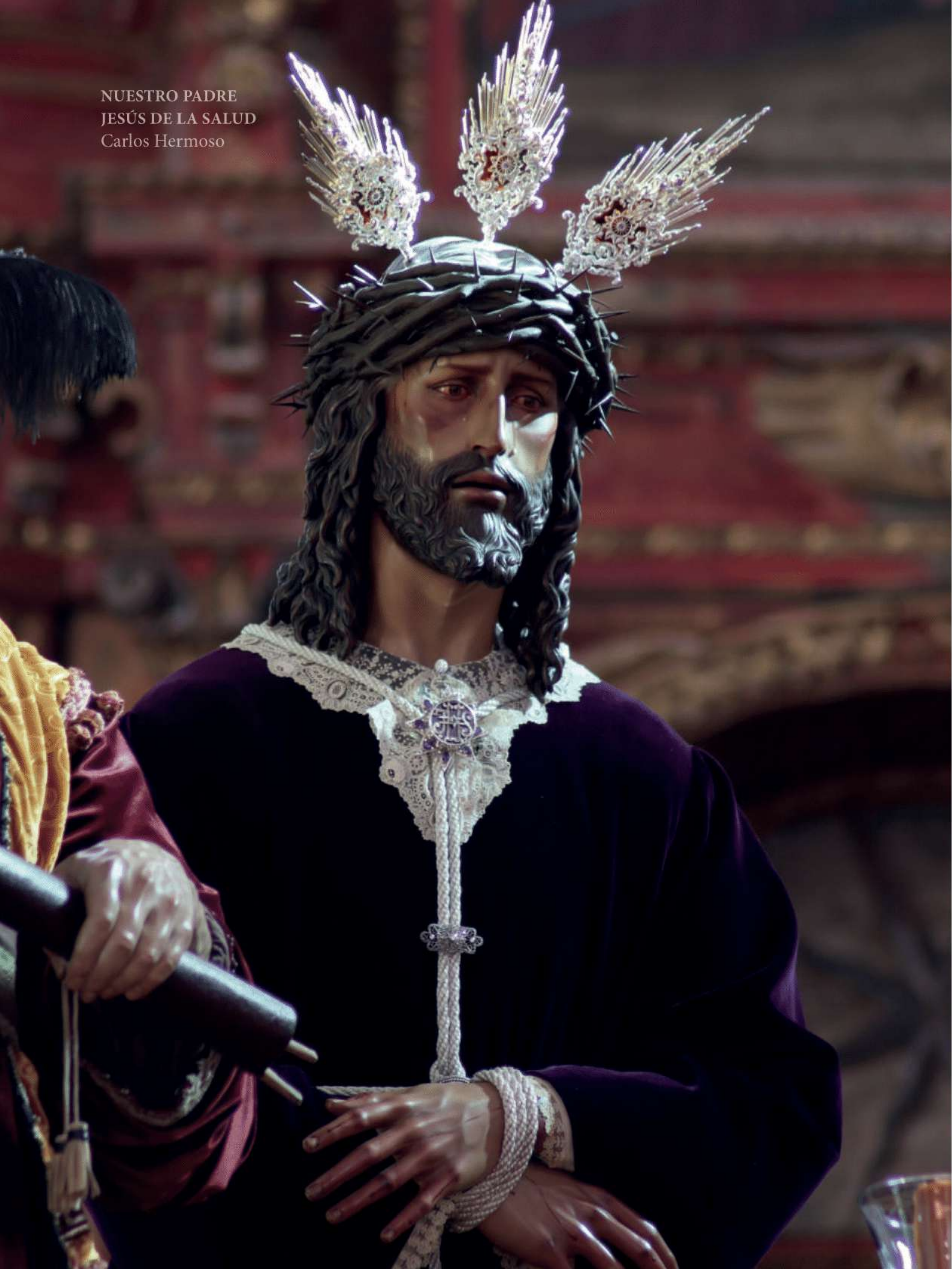
NUESTRO PADRE JESÚS DE LA SALUD Carlos Hermoso