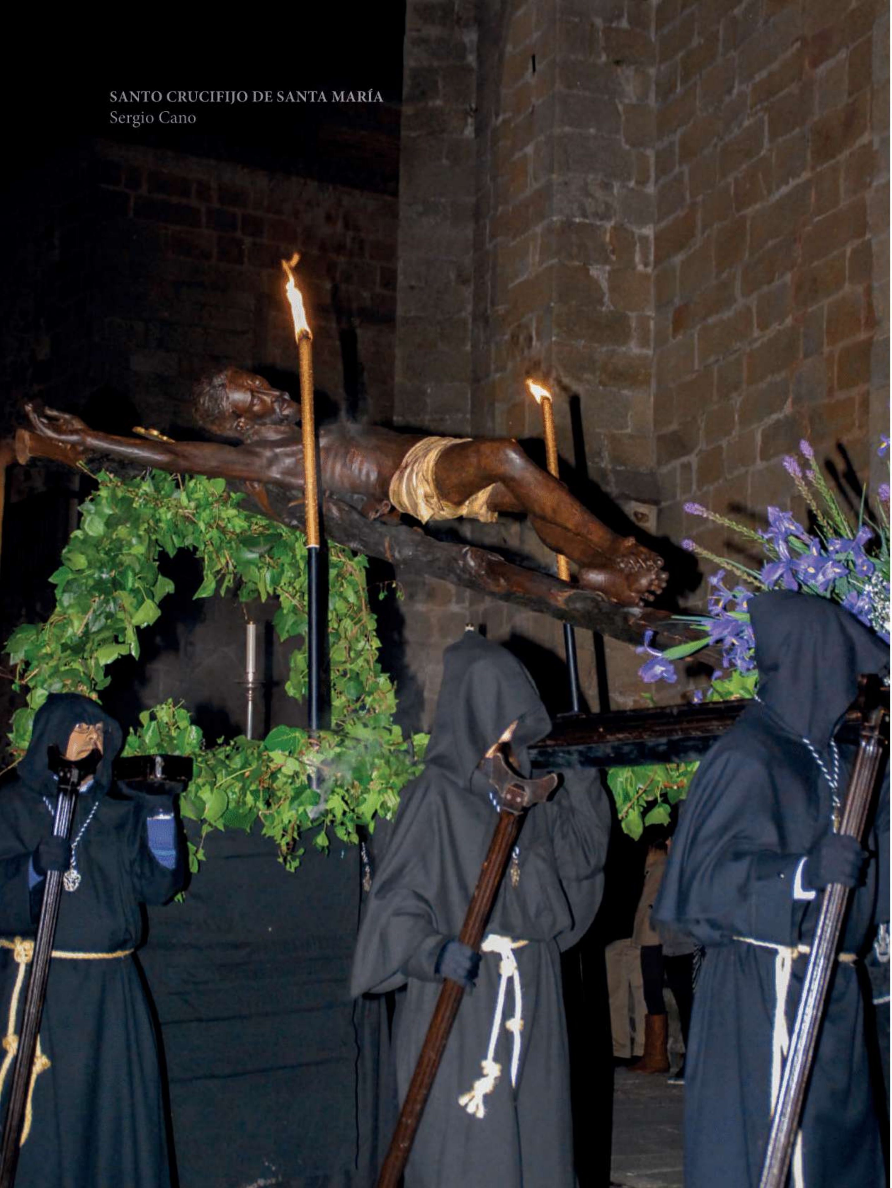
SANTO CRUCIFIJO DE SANTA MARÍA Sergio Cano