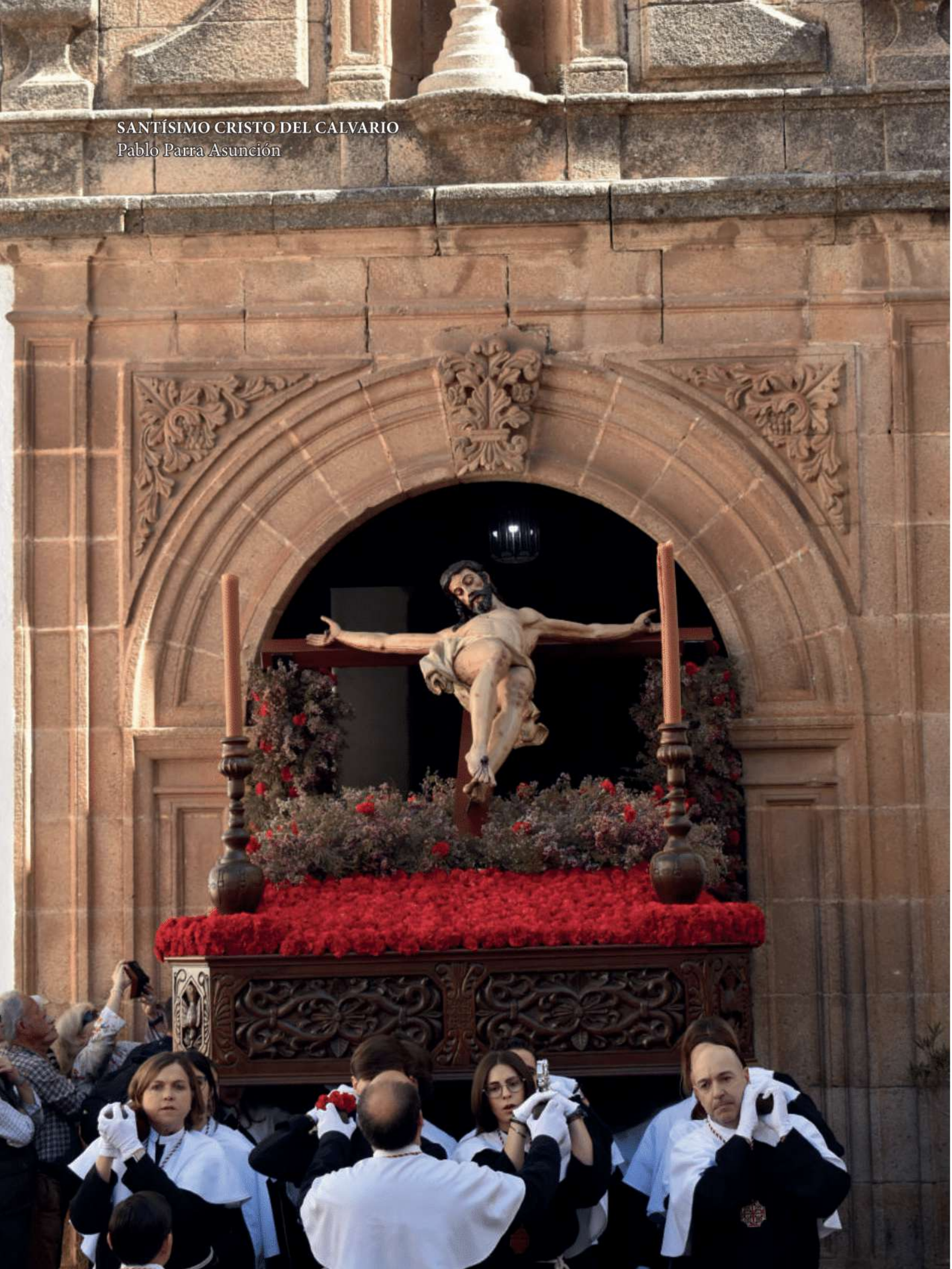
SANTÍSIMO CRISTO DEL CALVARIO Pablo Parra Asunción