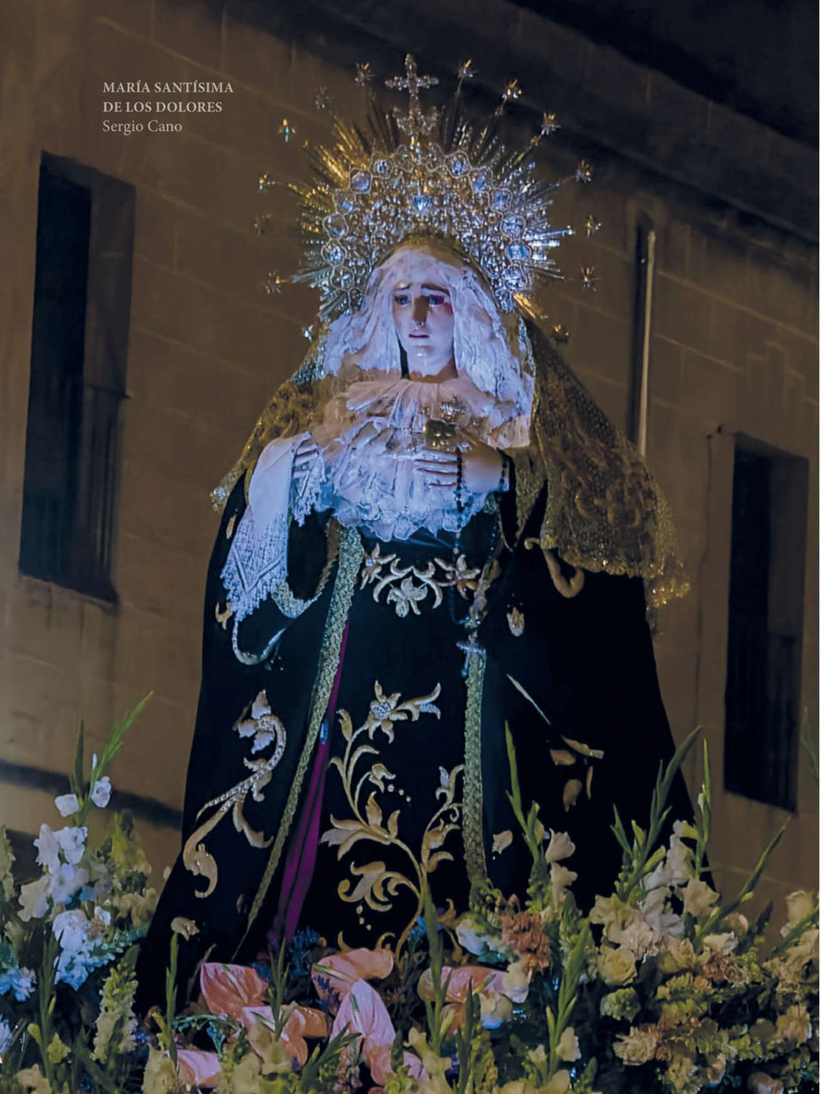
MARÍA SANTÍSIMA DE LOS DOLORES Sergio Cano