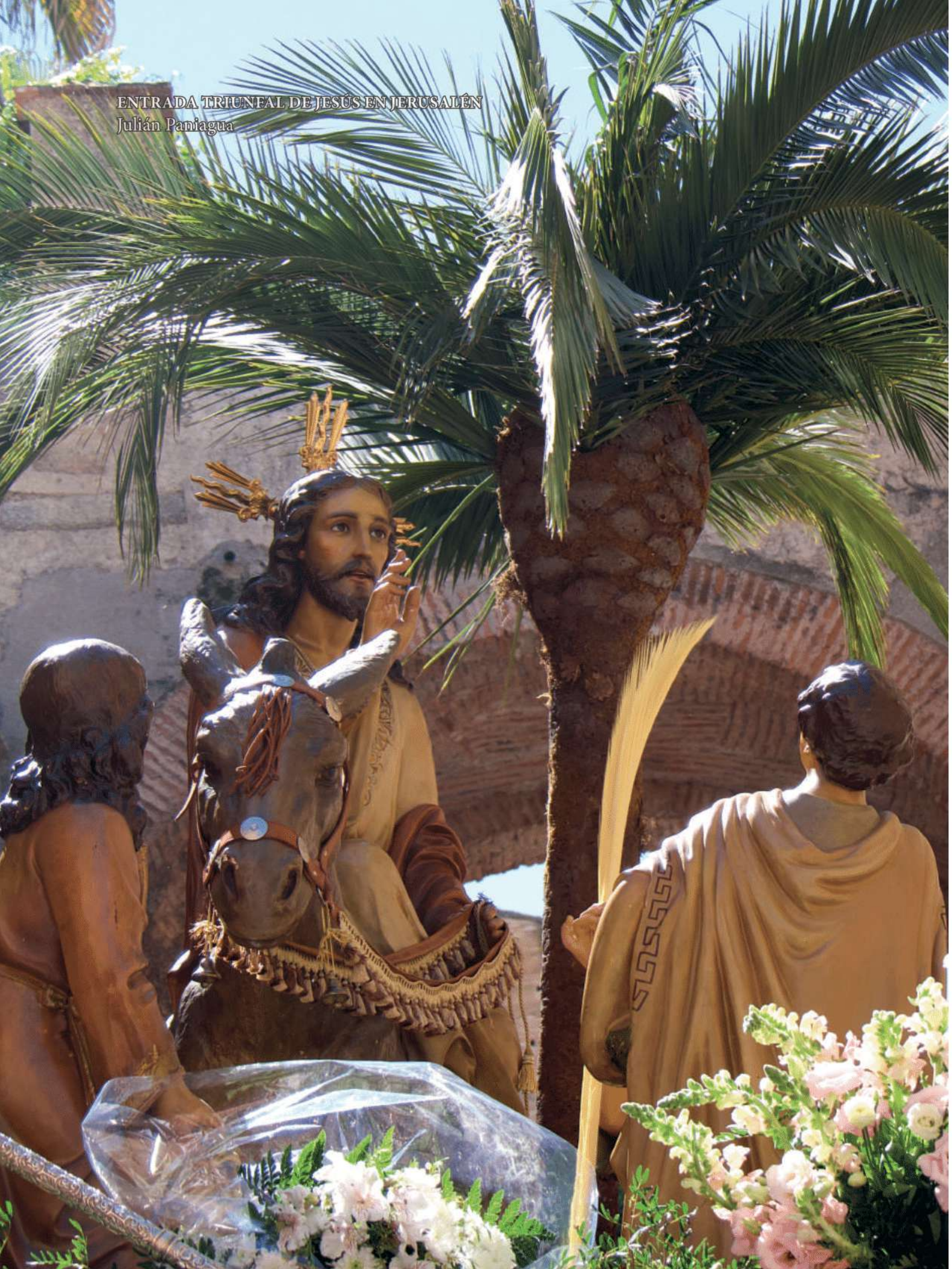
ENTRADA TRIUNFAL DE JESÚS EN JERUSALÉN Julián Paniagua